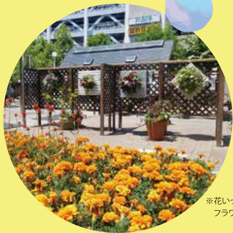
※花いっぱい運動記念碑と花いっぱいフラワーコンテストの写真(松本市)